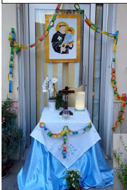
I Bambini dell'ACR Le signore del