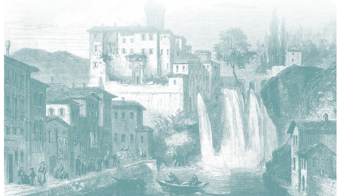
CASA LAURENTIA • Sala Palermo • Ingresso in via B. Carloni, 5 • Isola del Liri (FR)